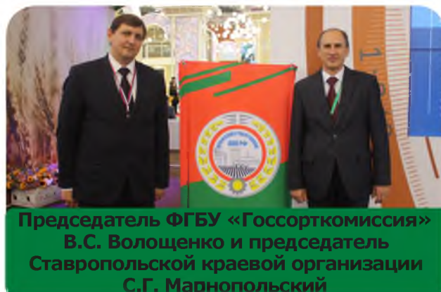
Председатель ФГБУ «Госсорткомиссия» В.С. Волощенко и председатель Ставропольской краевой организации С.Г. Марнопольский

«Сегодня агропромышленный комплекс по праву можно считать основным звеном и драйвером российской экономики. Нашим сельхозпроизводителям есть чем гордиться, имеется большой потенциал для приумноже-